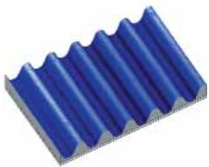
Halterung für Lichtwellenleiter