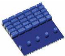
Bumps auf Wafer